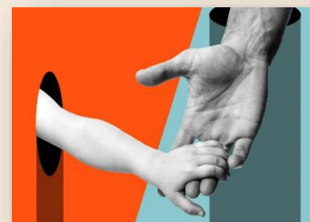
Fundação Francisco Manuel dos Santos

Assim, podemos olhar para o Dia Mundial da População como um momento para celebrar todos os progressos que já alcançámos, mas também refletir sobre o futuro. É importante não abdicar de uma perspetiva de longo prazo, sobretudo quando se fala em dinâmicas da população. E devemos ir além da retórica alarmista da extinção da população – talvez valha a pena lembrar que a ‘bomba da população’ dos anos 60 e 70 (do séc. XX) não explodiu.” (Fundação Francisco Manuel dos Santos). Leia Aqui o artigo completo