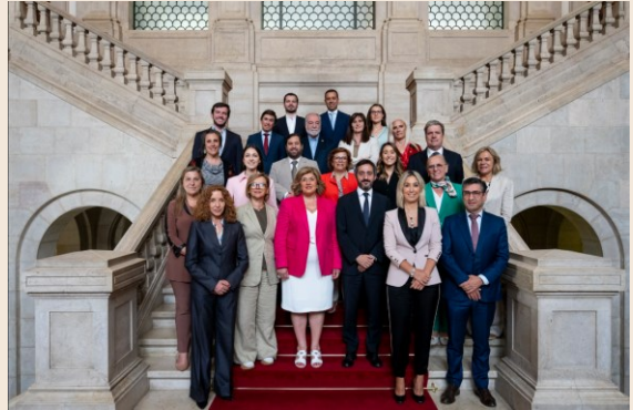
Membros da 8.ª Comissão Parlamentar de Educação e Ciência