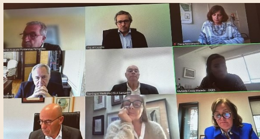
CNAES reuniu a 24 de fevereiro

Na reunião da Comissão Nacional de Acesso ao Ensino Superior (CNAES), a 24 de fevereiro, que contou com os representantes da APESP, ratificaram-se as propostas de provas de ingresso para os ciclos de estudo novos e para a Engenharia Eletrotécnica, já aprovadas por escrito. Foram igualmente aprovadas as deliberações que definem a correspondência entre os exames nacionais do ensino secundário e as provas de ingresso, bem como os pré-requisitos para candidatura à matrícula e inscrição no ensino superior, para o ano letivo 2025-2026. Por fim, apresentou-se a situação das homologias para 2025 e foram debatidas propostas relativas à equivalência dos exames do Liceu francês e à inclusão dos exames AICE e GCE para a substituição das provas de ingresso.