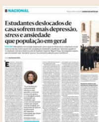
Artigo no Diário de Notícias

Um estudo do Instituto Superior Miguel Torga revela que os estudantes deslocados de casa sofrem mais depressão, stress e ansiedade que a população geral, sendo necessárias “estratégias integradas de prevenção e promoção da saúde mental”, destacou o Diário de Notícias .