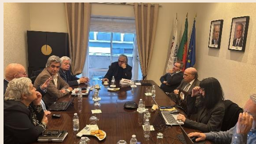
Direção da APESP reuniu a 13 de fevereiro

A direção da APESP esteve reunida a 13 de fevereiro para analisar e aprovar as propostas do Relatório de Atividades de 2024 e o Relatório e Contas relativo ao mesmo período. Este encontro serviu também para fazer a preparação e agendar a realização da Assembleia Geral ordinária da APESP. Foram igualmente analisados e ponderados os pontos a abordar na reunião com a A3ES (ver texto em baixo), assim como os próximos trabalhos a desenvolver no âmbito do Observatório.